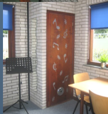
Van rommelhok tot prettige lesruimte