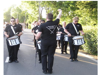
De slagwerkgroep brengt een vrolijke noot tijdens de avondvierdaagse Utrecht

We kunnen weer volop aan de slag, maar dat is iets wat onze slagwerkgroep wel is toevrouwd.